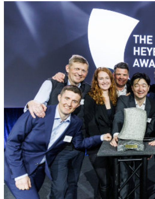
WALLENIUS WILLHELMSSENS ORCELLE WIND BLE TILDELTE HEYERDAHLPRISEN 2023. PRISEN BLE DELT UT AV THOR HEYERDAHL JR. .

Arbeidet med kompetanse, rekruttering og utdanning har som hovedmål å bidra til økt tilgang på kompetent arbeidskraft både på sjø og land, - nasjonalt og internasjonalt.