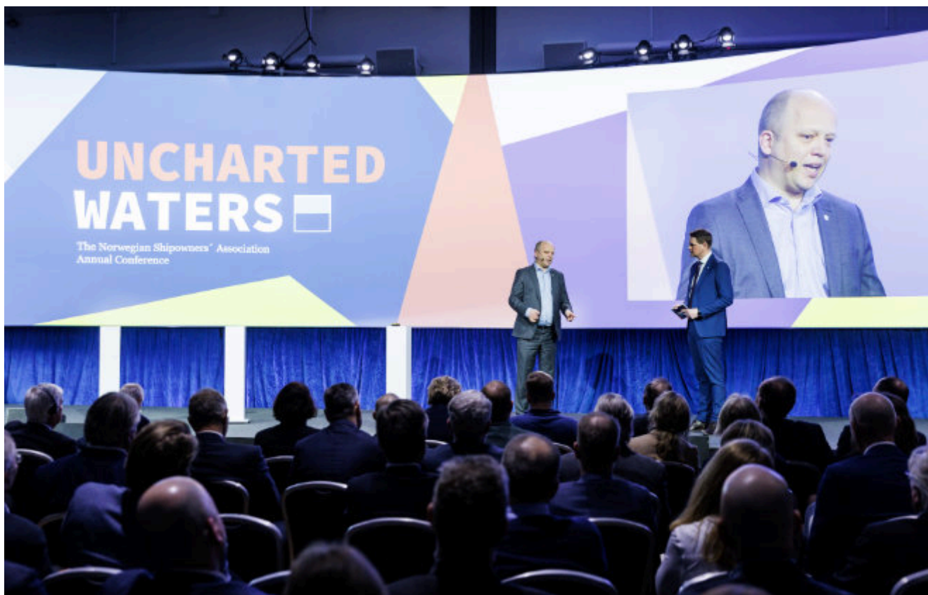
FINANSMINISTER TRYGVE SLAGSVOLD VEDUM I SAMTALE MED HARALD SOLBERG UNDER REDERIFORBUNDETS ÅRSKONFERANSE 2023.

utlysning av disse i løpet av 2025. NVE leverte også forslag om totalt 20 områder de mener kan være aktuelle for utredning av havvind.