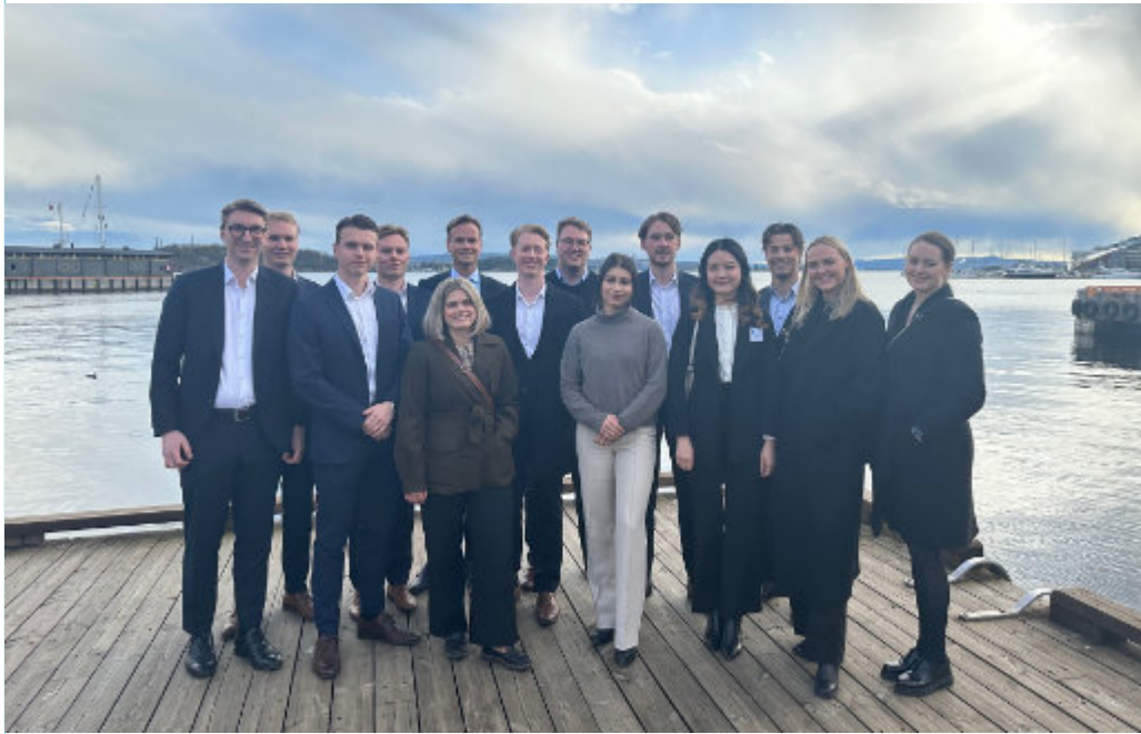
KULL 16 MARITIME TRAINEE.