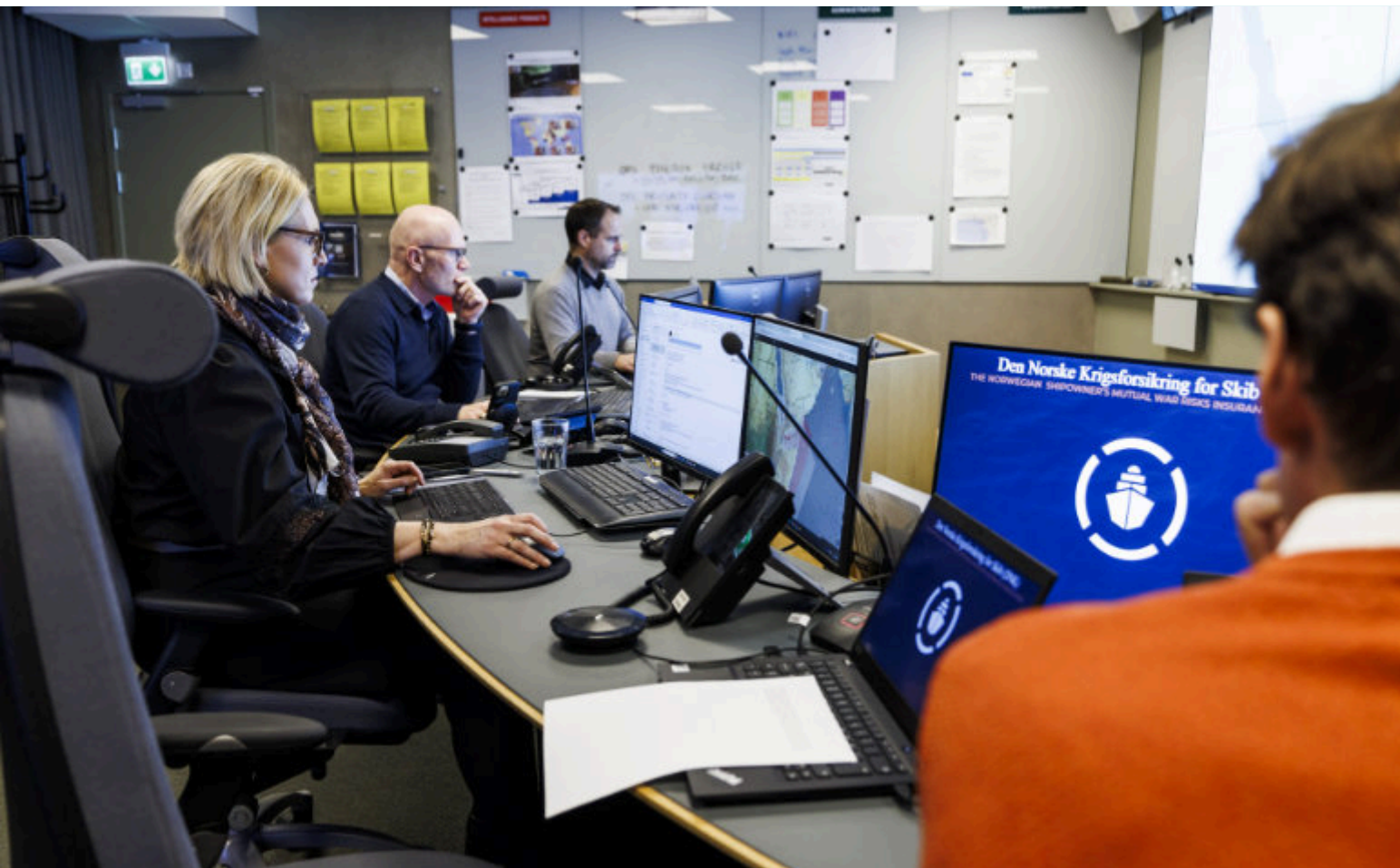
INTELLIGENCE & OPERATIONS CENTRE (IOC) HOS DNK ER EN DEL AV SKIPSFARTENS BEREDSKAPSSENTER, SOM BLE ETABLERT I 2023.

ses håndtering, og har bidratt til bedre informasjonsdeling, koordinering og responskapasitet i samarbeidet mellom DNK, NORMA Cyber og Rederiforbundet.